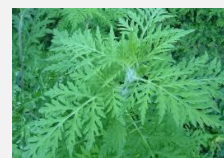
Stade de floraison